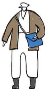
Дядько Левко (поштар)