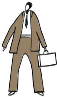
Оповідач (студент, який приїздить у рідне село)

Репресований, засланий у Сибір (звідти й пише листи до дружини) і ніколи вже звідти не повернеться